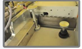
Kolay Yükseklik Ayarı İmkanı